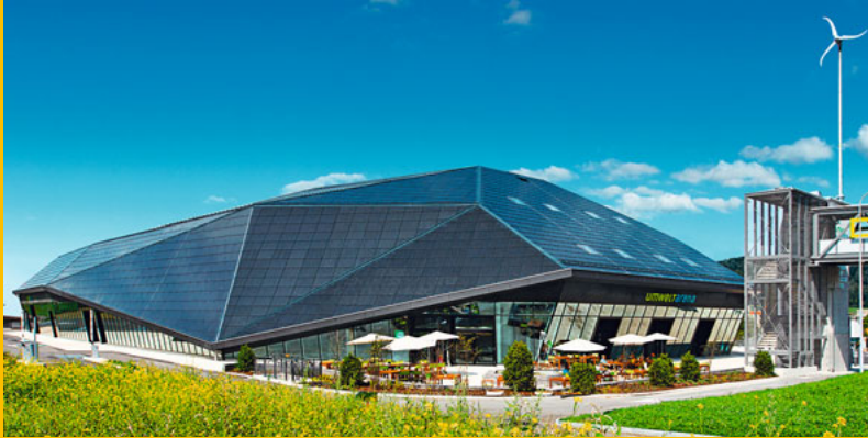
Umwelt Arena Spreitenbach