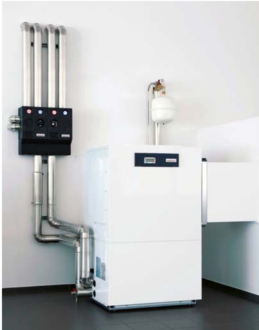
Luft-Wasser-Wärmepumpe von Weishaupt.