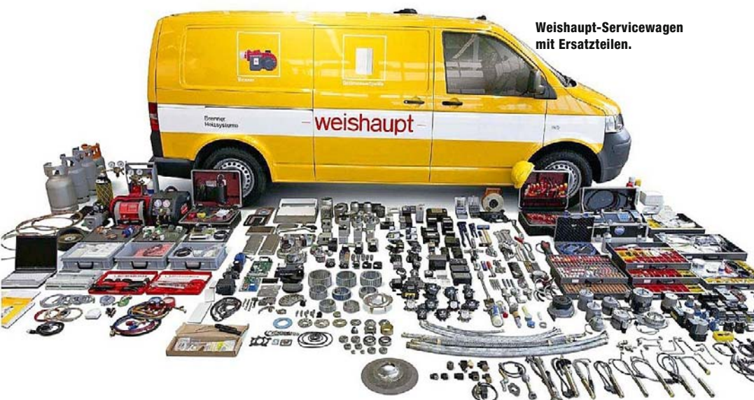
Weishaupt-Servicewagen mit Ersatzteilen.