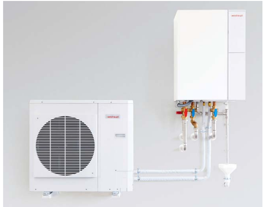
Splitwärmepumpe von Weishaupt, Aussengerät und Innengerät.

erfolgreiche bodenstehende Ölbrennwertkessel WTC-OB kann neu für einen Leistungsbereich bis 45kW eingesetzt werden. Auch in der Gasbrennwerttechnik wurde der Leistungsbereich erweitert. Mit dem bodenstehenden WTC-GB steht im Leistungsbereich von 90 bis 300 kW ein hocheffizientes und zuver-