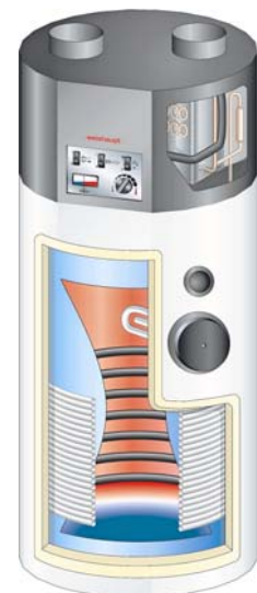
Warmwasserwärmepumpe WWP T 290.

Wärmepumpen deutlich vereinfacht. Sämtliche Hydraulikkomponenten sind im kompakten Gehäuse untergebracht. Der Kombi-Speicher kann raumsparend direkt an der Wand platziert werden, die Wärmepumpe wird entweder rechts oder links angeschlossen. Der massgebende Vorteil liegt in der kurzen Montagezeit, kleinem Platzbedarf und tieferem Preis gegenüber den Einzelkomponenten mit den gleichen hydraulischen Vorteilen.