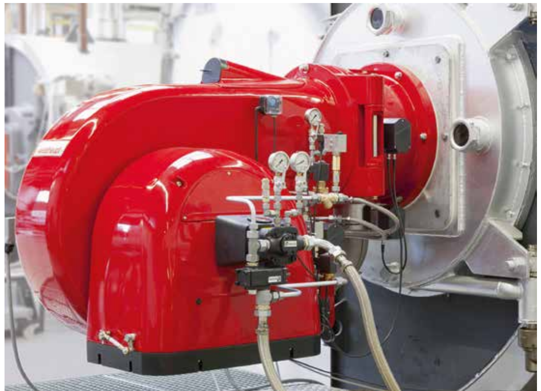
Weishaupt monarch® Brenner WM50

Weishaupt AG Chrummacherstrasse 8, 8954 Geroldswil Tel. 044 749 29 29, info@weishaupt-ag.ch www.weishaupt-ag.ch