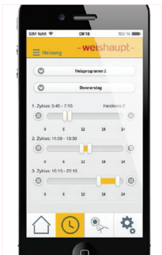
Die Einstellung der Zeitprogramme für mehrere Heizkreise und Heizzyklen.