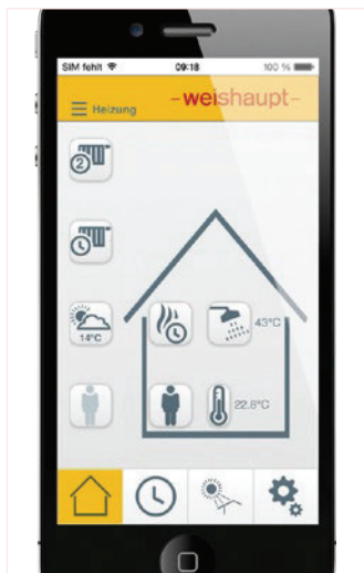
Startseite der App «Weishaupt Heizungssteuerung»: Darstellung der wichtigsten Werte auf der Startseite.

Die App «Weishaupt Heizungssteuerung» steht kostenlos bei Google Play und im Apple App Store zum Download bereit. Das Kommunikationsmodul WCM-COM ist als Zubehör für alle Weishaupt Gas- und -Öl-Brennwertsysteme WTC erhältlich. ■