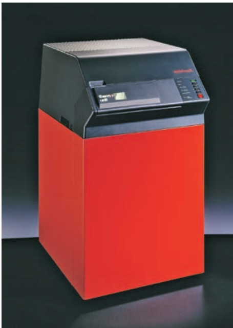
Erster 1989 in Sennwald gefertigter Niedertemperatur-Heizkessel WTU-G für Öl- und Gasfeuerungen. Wahlweise in 6 Leistungen von 15 kW bis 45 kW.

Das erste im Werk gefertigte Produkt war die Thermo Unit Guss (WTU-G). 1999 startete die Produktion der Weishaupt Thermo Unit Stahl (WTU-S), gefolgt vom Produktionsbeginn der Brennwertgeräte im Jahr 2001, zunächst der Gas-Baureihen Thermo Condens WTC-A mit 15 bis 60 kW. Von 2007 bis jetzt sind die bodenstehenden Brennwertkessel bis hoch zu den 300-kW-Geräten hinzugekommen und die wandhängenden sowie bodenstehenden Ölbrennwertgeräte bis 45 kW. Mit der ausgereiften Systemtechnik für jeden Wärmeerzeuger ergibt sich so ein optimales Angebot sowohl für Neubauten als auch für den Sanierungsmarkt.