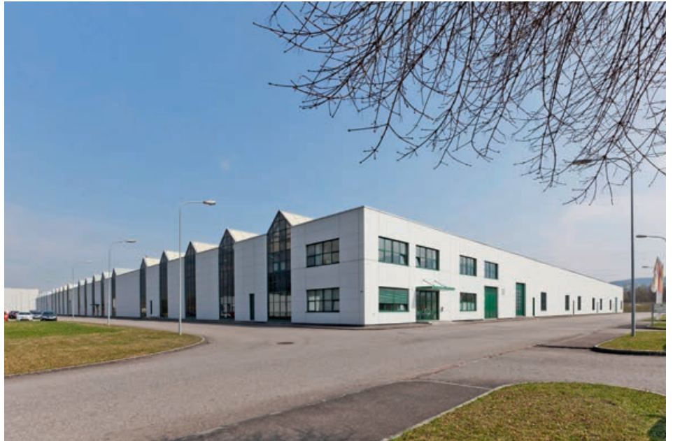
Die Pyropac AG in Sennwald hat sich in den 25 Jahren ihres Bestehens zu einer tragenden Säule des Gesamtunternehmens entwickelt.