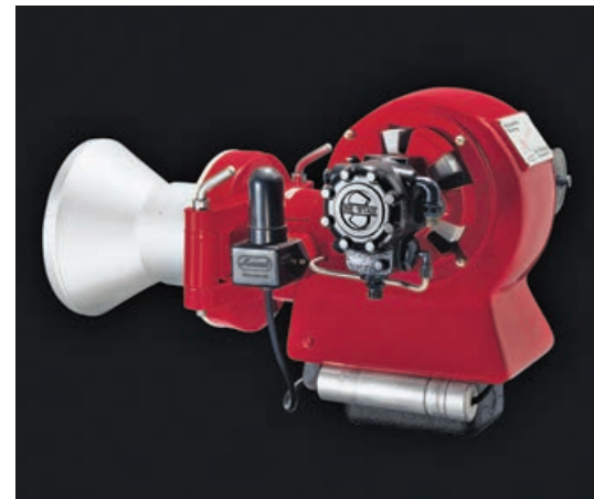
Die ersten Monarch-Brenner gehen 1952 in Serie: Weishaupt bediente damit die aufkommende Nachfrage nach automatischen Feuerungsanlagen mit flüssigen Brennstoffen.

nen aus erster Hand. So auch im März 2013, als die geplante Einführung einer Energieetikette im EU-Raum thematisiert wurde. Dieses Energie-Label soll künftig im Bereich der Wärmeerzeugung und Trinkwasseraufbereitung Auskunft über die Energieeffizienz von Einzelkomponenten und Gesamtsystem geben; auch die Schweizer HLK-