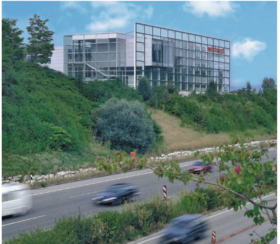
Das Verwaltungs- und Schulungszentrum in Geroldswil – direkt an der Autobahn – ist ein Kompetenzzentrum zur Aus- und Weiterbildung von Fachleuten.

Schweiz als Geschäftsführer leitet. Dabei hat sich das Unternehmen seit Beginn – damals mit Chef und 3 Angestellten – ständig weiterentwickelt und blickt mit heute über 70 Mitarbeitenden in Geroldswil, davon nahezu 40 Kundendiensttechnikern und 10 Verkäufern, auf ein gesundes Wachstum zurück. Dabei gilt als Credo, dass Werte und Eigenschaften wie Zuverlässigkeit, Verantwortung, Innovation, Service, Fachkompetenz und Pflichtbewusstsein hochgehalten werden.