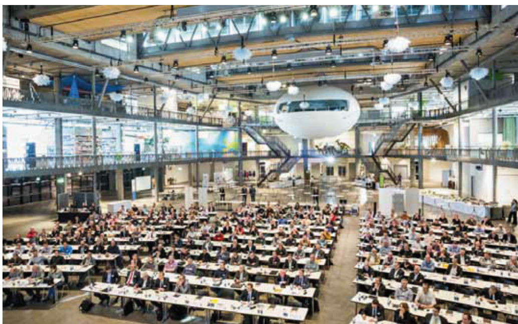
Die Umwelt Arena passte optimal auch mit den Themen und war mit den nahezu 350 Teilnehmer gut gefüllt.