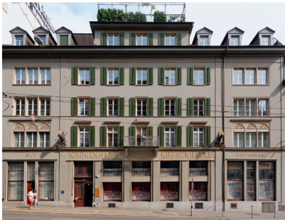
Die weltbekannte Kronenhalle an der Zürcher Rämistrasse.

1924 übernahmen Hulda und Gottlieb Zumsteg das inzwischen zum «Hotel de la Couronne»