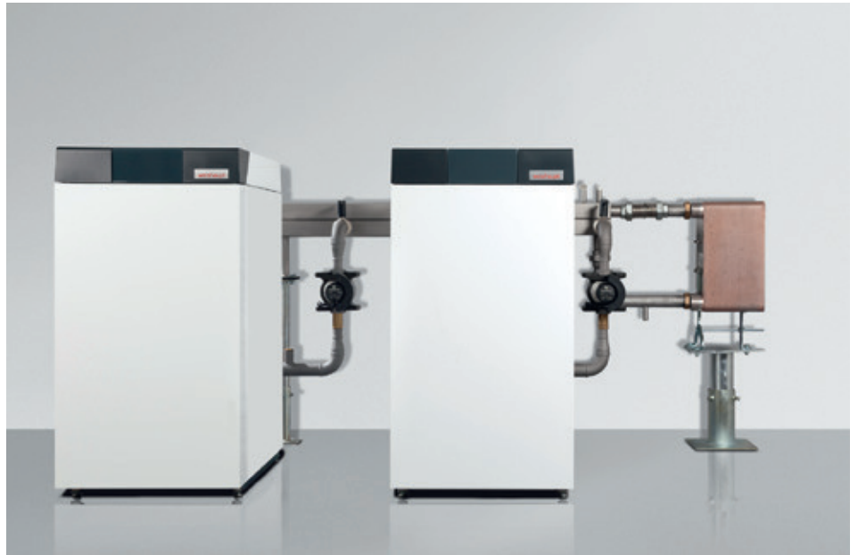
Gas-Brennwertkessel Weishaupt Thermo Condens WTC-GB in Kaskaden-Kombination für mehr Leistung.

Für die neuen Anlagen mussten auch «jede Menge Expansionsanlagen» (Franco Meier) installiert werden; insgesamt sind es im OG und im Keller zusammen acht. Sämtliche Lüftungskanäle in den Restaurants wurden ersetzt; bei den Chromstahl-Steigleitungen genügte eine gründliche Reinigung. Die ganze Anlage wird über ein SPS-System gesteuert, dem die Steuerungen von Kessel und Kältemaschinen zugeschaltet sind – «und alles funktionierte vom ersten Tag an tadellos», stellt Meier zufrieden fest.