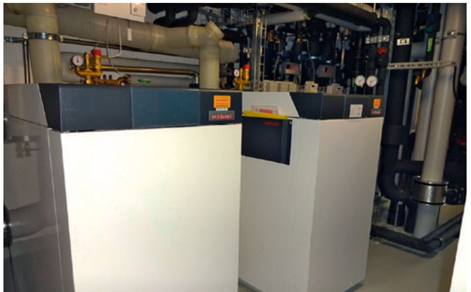
Unten: Die Weishaupt-Gaskessel mit je 200 kW liessen sich mit optimaler Leistung auf engstem Platz installieren.