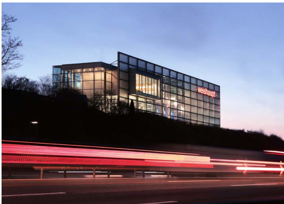
Ausbildungs- und Kompetenzzentrum der Weishaupt AG in Geroldswil