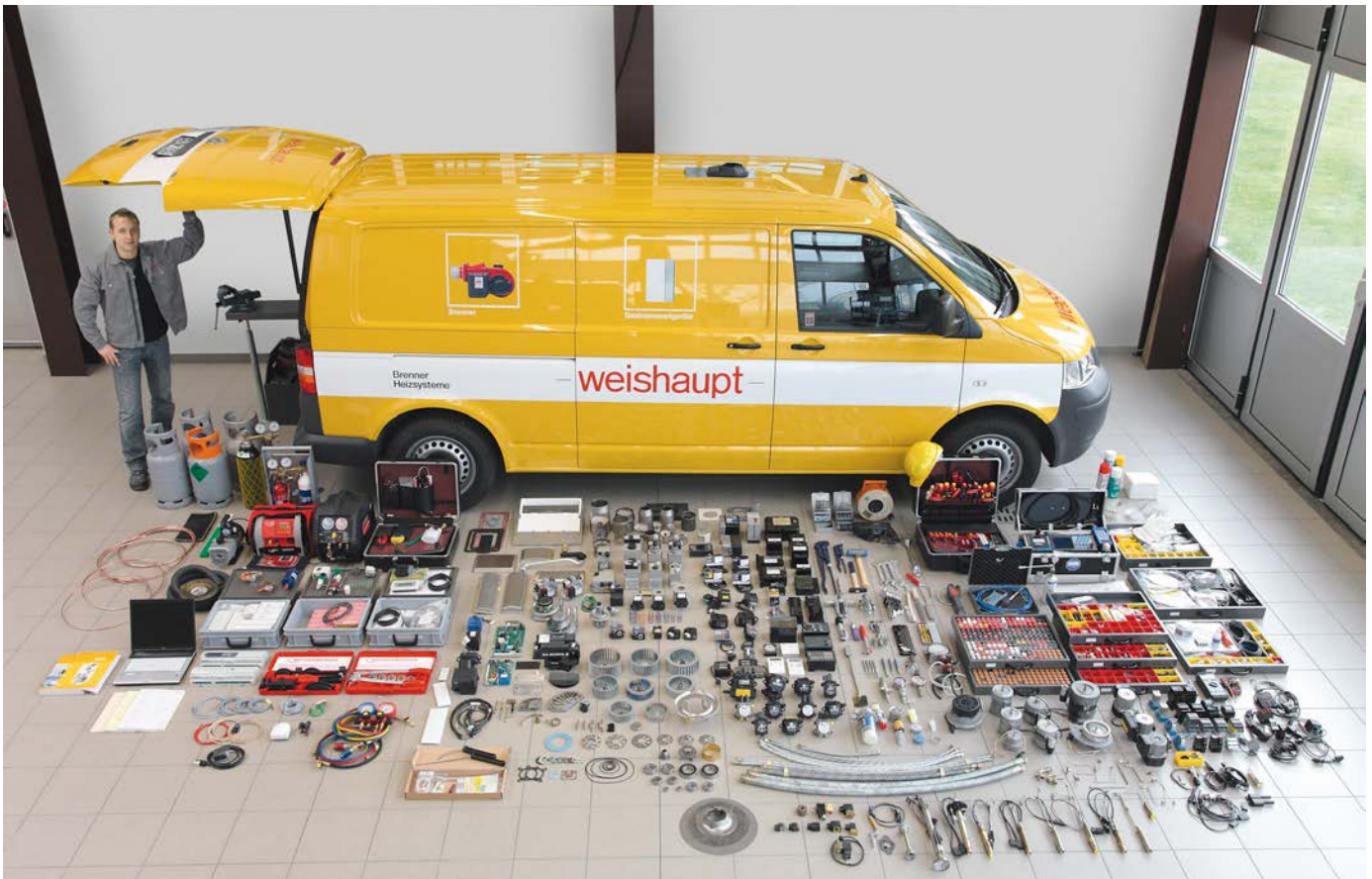
Komplett mit Spezialwerkzeug und Ersatzteilen ausgerüstetes Servicefahrzeug

sind mit einer Datenschnittstelle ausgerüstet. Dadurch erkennt der Servicetechniker die Störungsursache mit dem Laptop und kann sofort die richtigen Massnahmen treffen. Diese umfassenden Informationen optimieren die Störungserkennung und deren Behebung. Ein grosses Plus ist die Flexibilität des Weishaupt-Services. Wenn Not am Mann ist – Weishaupt ist zur Stelle. Der technische Kundendienst steht Weishaupt-Kunden 24 Stunden, 7 Tage die Woche zur Verfügung. Der Notfalldienst ist damit gewährleistet, ganz nach dem Motto «Wir sind da wo Sie uns brauchen».