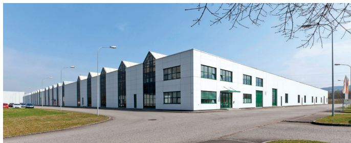
Die Pyropac AG im St.Gallischen Sennwald.

E-mail info@weishaupt-ag.ch Internet www.weishaupt-ag.ch