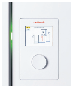
Das neue Gas-Brennwertgerät Thermo Condens WTC-GW 15/25-B.