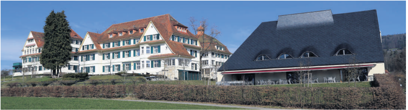
Die Gebäude der Hohenegg in Meilen, vorne rechts das neue Receptions-Haus «Terrazza».

Weber nun den aktuellen Heizleistungsbedarf und kam auf wenig mehr als einen Drittel der vorherigen Heizungsleistung: 500 kW!