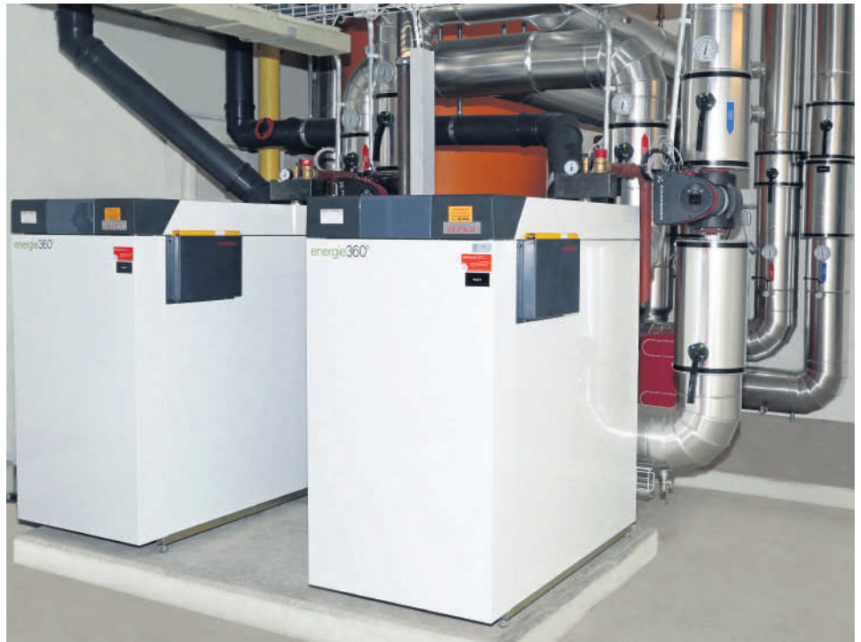
Die beiden Weishaupt Thermo Condens WTC GB 250 in der Hohenegg, Leistung je 48–239 kW.

Die runden Premix-Strahlungsbrenner der Thermo Condens-Kessel weisen dank ihrer speziellen Oberflächen-Gewebestruktur zudem äusserst niedrige Schadstoffemissionen auf. Der Weishaupt-Kaskadenmanager der Mehrkesselanlage steuert unter anderem die systematische Arbeitsweise und sorgt für nahezu identische Laufzeiten beider Kessel. Der serienmässige Geräuschdämpfer, der nur minimale Betriebs- und Anfahrgeräusche zulässt, ist hier nur ein kleiner Vorteil im Vergleich zu den Geräuschemissionen der vorherigen Gebläsebrenner. Ein elektronisches Überwachungssystem kontrolliert über Fühler im Abgas, Vor- und Rücklauf sowie durch einen Wassermangelschalter