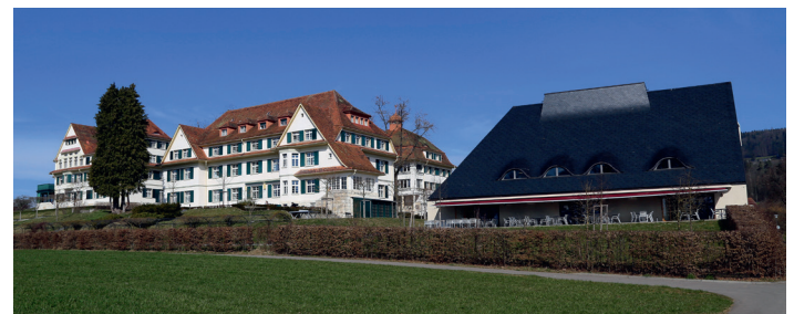
Die Gebäude der Hohenegg in Meilen, vorne rechts das neue Receptions-Haus «Terrazza»

► WEITERE INFORMATIONEN: Weishaupt AG Chrummacherstrasse 8 8954 Geroldswil Tel. 044 749 29 29 E-Mail: info@weishaupt-ag.ch Internet: www.weishaupt-ag.ch