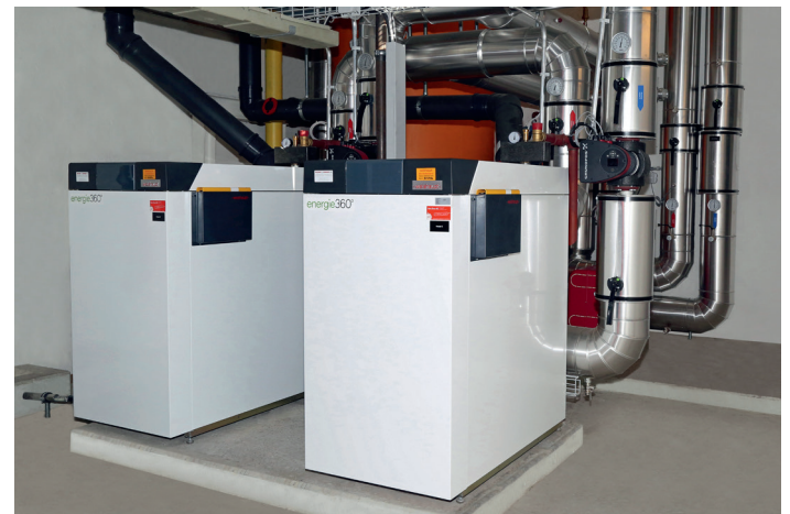
Die beiden Weishaupt Thermo Condens WTC GB 250 in der Hohenegg