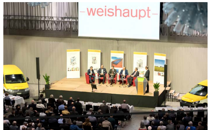
Über 400 interessierte Fachleute aus den Gebäudetechnikbranchen bewiesen einmal mehr die Bedeutung des Weishaupt Ingenieur Fachzirkels.

Nach den eher theoretischen und gesetzlichen Voten war interessant zu erfahren, welche technischen Neuerungen die Ingenieure und Entwickler der Max