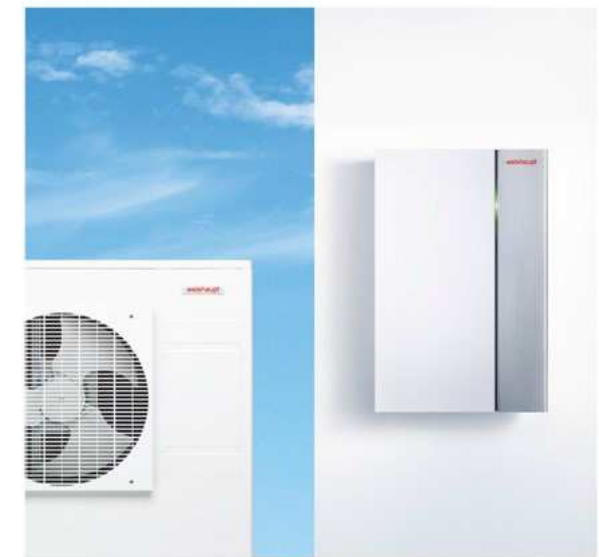
Aussengerät der neuen Splitwärmepumpe

Das Aussengerät liefert die Wärme ins Haus. Eine Reihe innovativer technischer Details, wie der Doppel-Rollkolbenverdichter und das BiFlow-Expansionsventil oder der im Windkanal optimierte Ventilatorflügel, sorgen dafür, dass das Aussengerät effizient und sehr leise läuft – zuverlässig bis zu Aussen-temperaturen von -20\text{ }^{\circ}\text{C} .