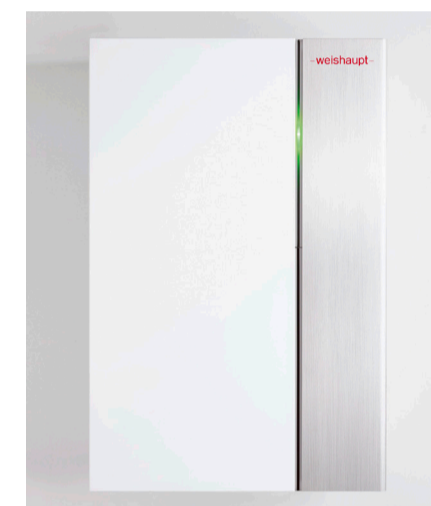
Das neue Gas-Brennwertgerät WTC-GW 15/25-B erstmals in der Schweiz am WIF vorgestellt.