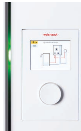
Bediengerät mit farbigem Display.

Gebäuden ist enorm», sagte der Organisator des Fachzirkels und der Geschäftsführer der Weishaupt AG. «Der WIF will anhand von praxisorientierten Beispielen und Lösungen zeigen, was bereits umgesetzt ist und was Weishaupt zur Energieeffizienz-Steigerung beiträgt.» Diesbezüglich gab es viel zu berichten, da das Thema Energieeffizienz beim Unternehmen omnipräsent ist. Dazu wurden einige interessante Lösungen präsentiert.