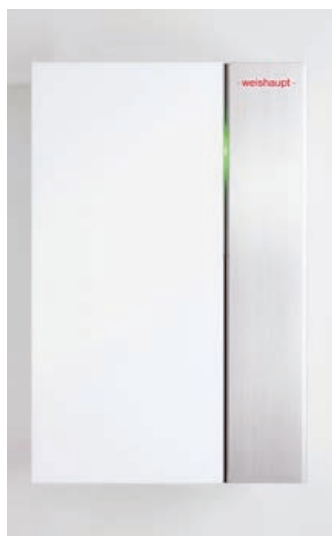
Das neue, effiziente Gas-Brennwertgerät «Thermo Condens WTC-GW 15/25-B».