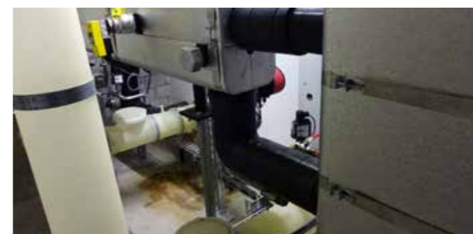
Rückansicht der Kessel mit Weishaupt-Kaskade.