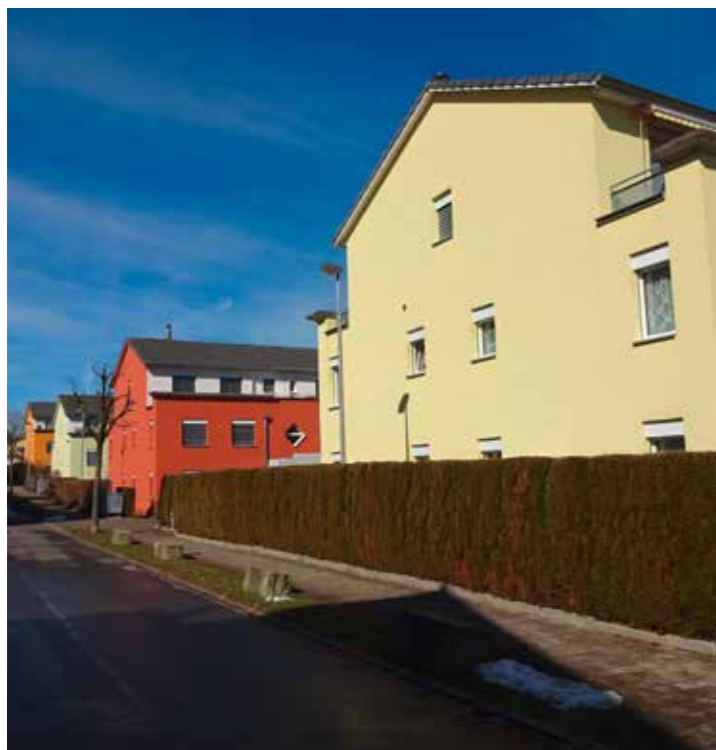
Teilansicht der Siedlung Bärenweidstr. Samstagern.