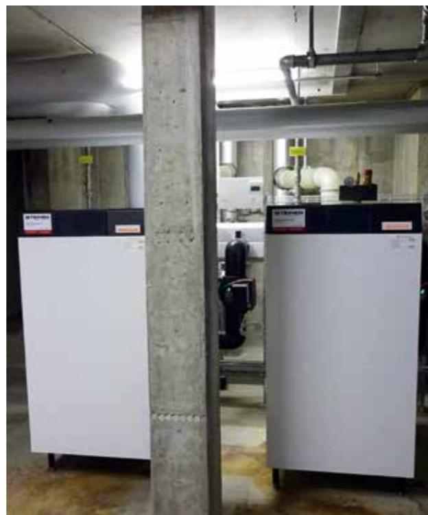
Die beiden Weishaupt Thermo Condens WTC-GB 300 Gas-Brennwertkessel in der Bärenweid-Zentrale.