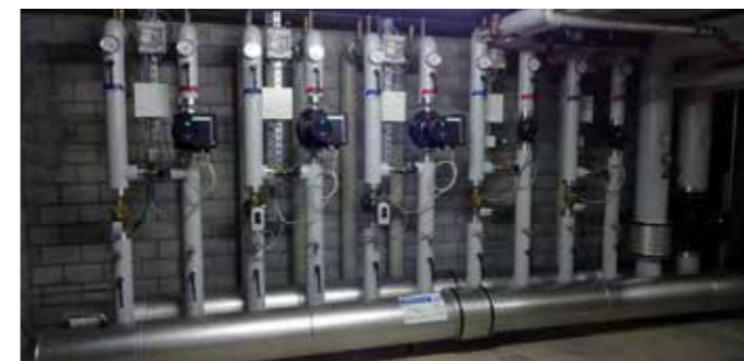
Die Verteilanlage in der Heizzentrale.