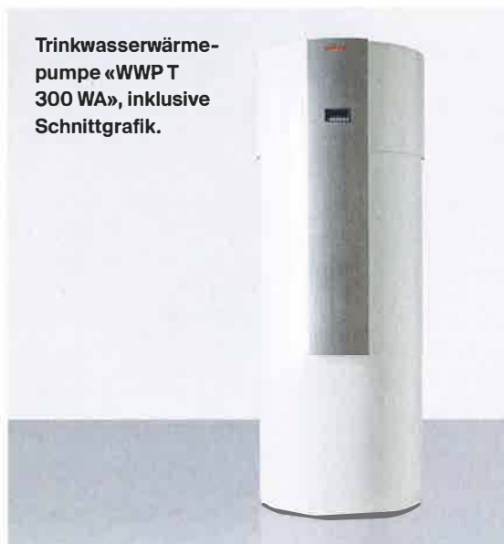
Trinkwasserwärmepumpe «WWP T 300 WA», inklusive Schnittgrafik.

HOHE EFFIZIENZ Die neue Trinkwasserwärmepumpe lässt keine Wünsche offen.